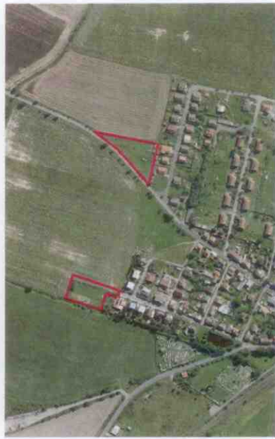
b) SCHEMA POŽADAVKŮ