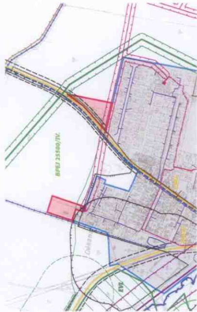
a) LIMITY VYUŽITÍ ÚZEMÍ